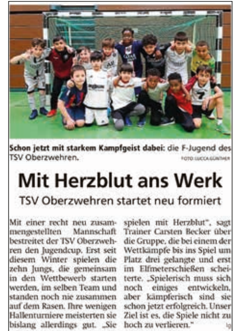
F-Jugend bei Interview der HNA zum HNA-Eon Cup

So wurden die Jungs, nach verlorenem Halbfinale und Spiel um Platz 3, leider nur undankbarer Vierter. Es war, unter dem Strich, aber eine sensationelle Leistung. Immer nur mit einem Tor im 8-Meterschießen zu ver-