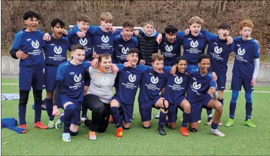
C1 aktuell Gruppenliga 2. Platz