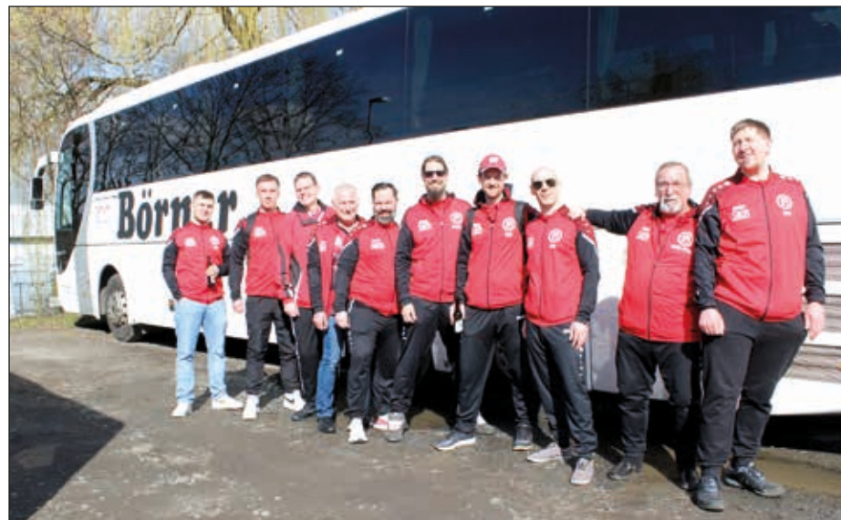
Vereinsfahrt nach Rimbach – Verbandspokal