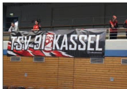
Fankurve in Rimbach