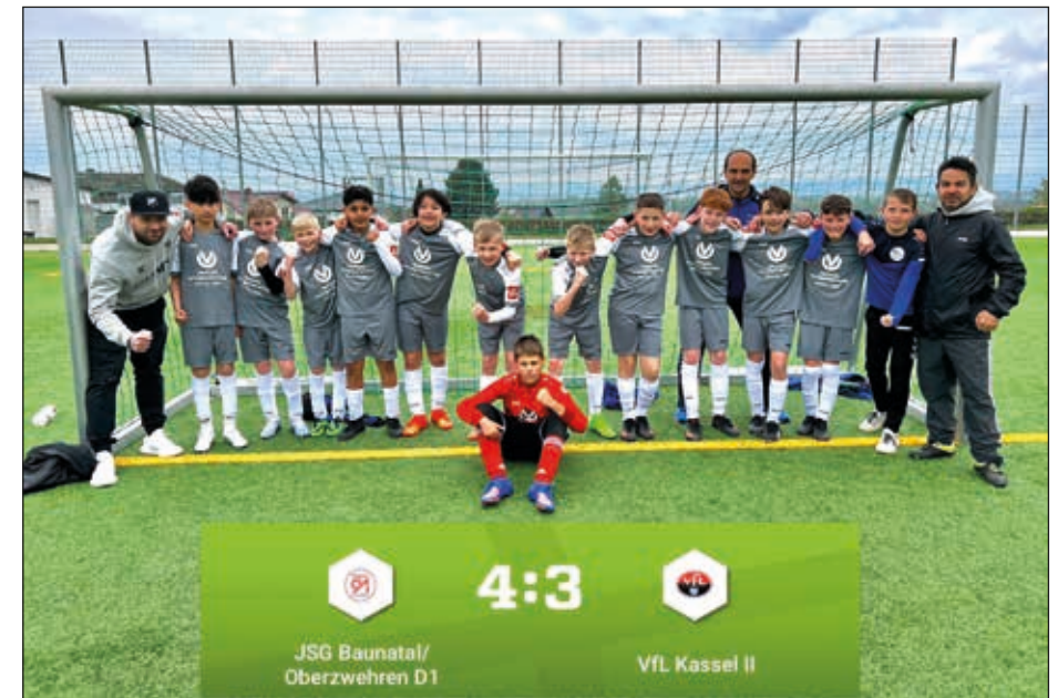
Erfolgreiche D1 im Spiel gegen VFL 2

Bei der D1 (Kreisliga) passt es auch leistungsmäßig sehr gut. Die Mannschaft belegt aktuell, in einem Feld mit OSC Vellmar, KSV Baunatal und VFL, einen guten 4. Platz und hatte einen hervorragenden Auftritt im Pokal gegen die Gruppenligamannschaft vom VFL. Hier wurde die Mannschaft, nach einer dominierenden 2. Halbzeit, mit vielen Latten- und Pfostentreffern nicht belohnt. Das entscheidende 1:2 für den VFL fiel in der Nachspielzeit. Es war eine sehr bittere Erfahrung für unsere Jungs.