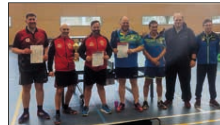
Bezirkspokal gewonnen gegen TSV Marbach IV