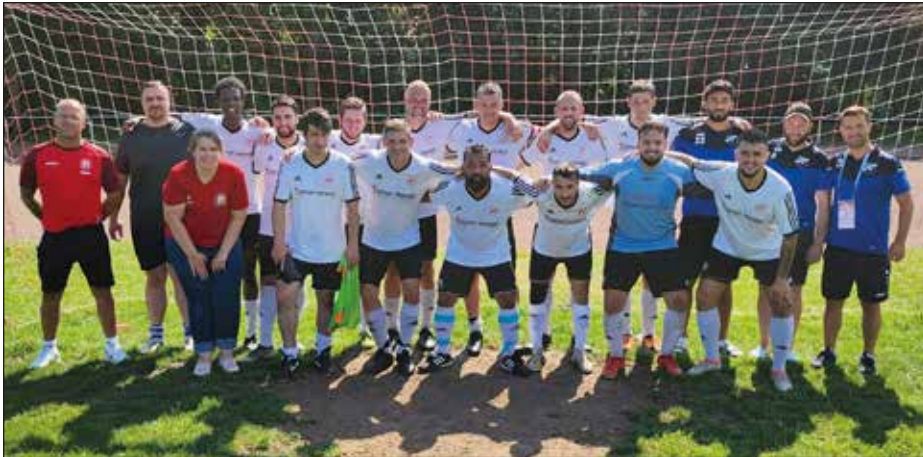
SG Rengershausen II/Oberzwehren I nach dem 5:1 Sieg gegen Vollmarshausen II