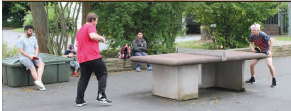
Tag des Tischtennis

In der 2. Ferienhälfte ist das Training wieder aufgenommen worden. Wie schon erwähnt gehen 3 Teams an den Start. Team 1 wird als Neuling in der Kreisliga top aufgestellt zu den Favoriten gehören.