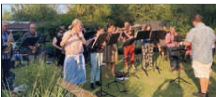
Egerländer am Himmelfahrtstag in Nieste ↑