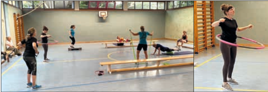
Fitness II: Zirkeltraining muss sein