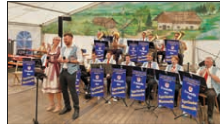
Unsere Egerländer bei der Wehlheider Kirmes

Und was wäre die Wehlheider Kirmes ohne unsere „Egerländer“. Sie durften auch am 20. August nicht fehlen und brachten das Festzelt beim „Düsseldorfer Hof“ wieder richtig zum Beben.