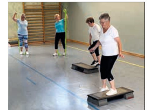
Fitness I: Zirkeltraining immer vor den Ferien