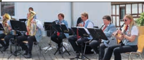
Blasorchester gemischt mit MV Harth in He-Li ↓