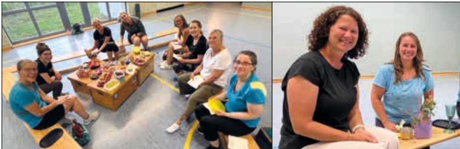
Fitness II: gemütliches Zusammensein wie jedes Jahr vor den Ferien