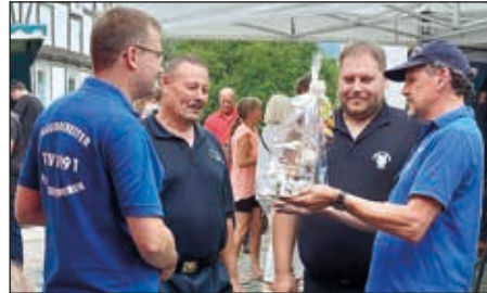
Glückwünsche und musikal. Umrahmung 100 Jahre FFW Oberwehren

Herzlichen Glückwunsch nochmal zum 100-jährigen.