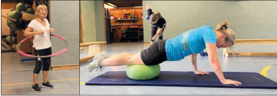
Fitness I: Spaß